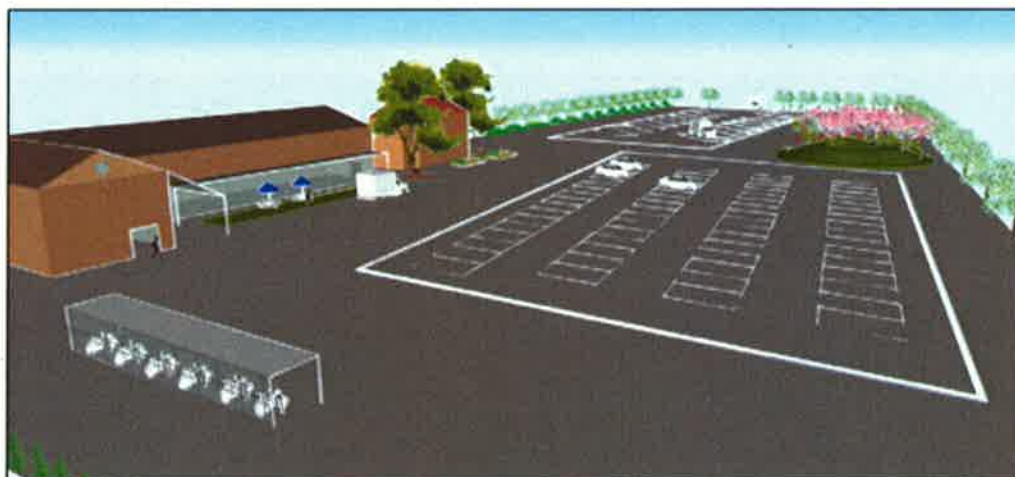
北側からのイメージ